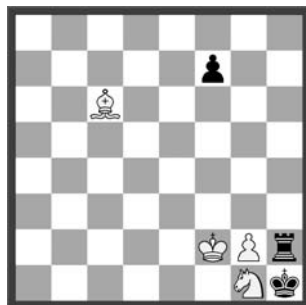
14616 Baldur Kozdon Flensburg (D)