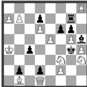
3 Lösungsturnier Interlaken 1937