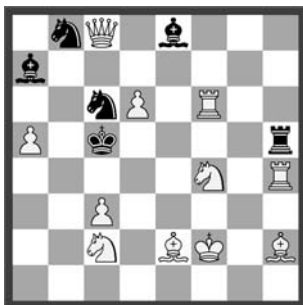
14611 Herbert Ahues Bremen (D)

14604 K. Brenner. 1. Sb4! Kb1! (1. ... Kb2? ... 3. Kb3 und matt im 6. Zug) 2. Sbx2 Kb2 3. Kb4 Ka1 4. Kb3 Kb1 5. Ka3 Ka1 6. Sb3+ Kb1 7. Sc3. Ein Fund! «Eine reizvolle Miniatur auf engstem Raum!» (WL). «Ein Leichtgewicht mit einigen Tempofinissen» (JK).