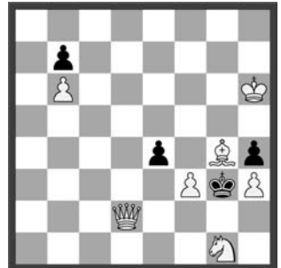
4 Turnierprogramm 1952