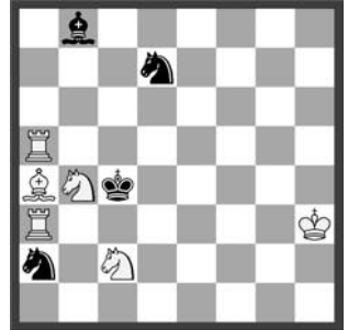
2 Zürcher Turnierbuch 1934