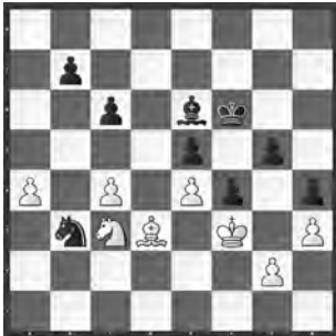
Sakajew – Jenni EM Blitz, Palermo, 2002