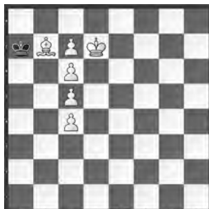
14969 Hannes Baumann Zürich

# 4 (b-d = je # 3!) 6(7)+1 b) Bc6→a6 c) +wSe5 d) +wBc3