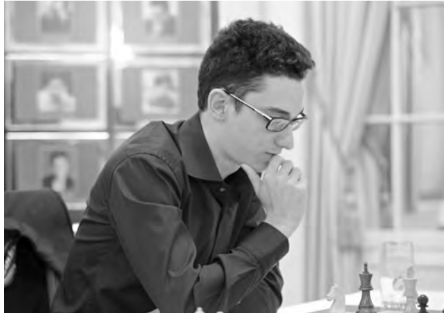
Fabiano Caruana rückte dank seines Siegs im Rapid-Turnier noch auf Rang 2 vor.

39. ♖xg7! Nakamura bleibt in dieser Partie nichts erspart – er