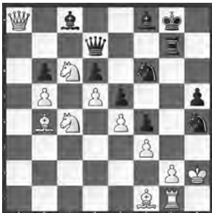
Hecht – Jenni Bodensee-Cup, 1998

Schwarz am Zug. Alles steht bereit. Greifen Sie an!