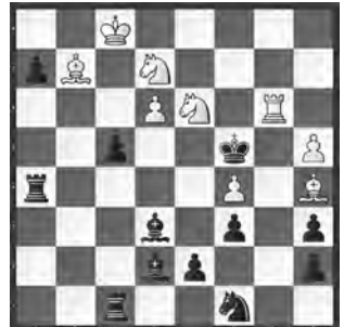
4 Yehuda Lubton Die Schwalbe 1993 (Runde 2)