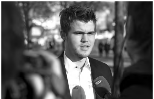
Auch neben dem Schachbrett war Weltmeister Magnus Carlsen in Zürich ein gefragter Mann – hier beim Interview mit dem Schweizer Fernsehen.

7. ... ♚d6 8. ♘c3!? In vielen Partien folgte hier 8. Sbd2. Doch Carlsen will seinen Damensprin-