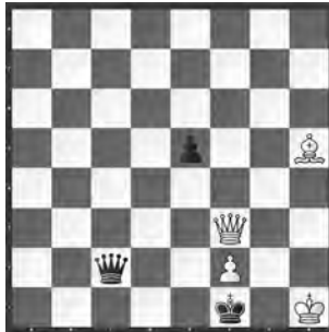
1. ehr. Erwähnung Nr.14880 Baldur Kozdon (D)

► 2. Ehrende Erwähnung 14855 («SSZ» 7/2011) von Leonid Makaronez. Nur noch selten findet man originelle gehaltvolle Miniaturen wie diese (die Datenbanken enthalten nichts Vergleichbares). Hier reichhaltiges Spiel, in dem der sL an verschiedenen Stellen blockt. Schon die Variante 1. Lg8! Lg7 2. Lxf7 Lf8 3. Dg5+ mit Opfer des wL und 2. ... Lh6 3. Kxh6 ergäben eine nette Miniatur. Mich beeindruckte aber die überraschende Rückkehr der beiden Läufer mit Parallelzügen 2. ... Lh8 3. Lg8, die das Stück über das Lobniveau hinaushebt. Die Angabe der «Dro-