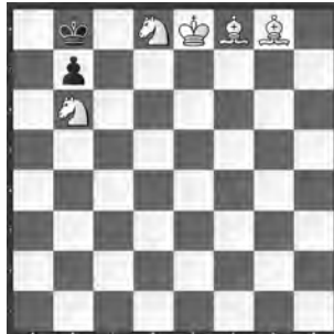
14967 Eligiusz Zimmer Piotrkow Tryb (PL)