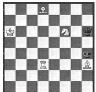
14970 Baldur Kozdon Flensburg (D)

# 4 (b-d = je # 3!) 6(7)+1 b) Bc6→a6 c) +wSe5 d) +wBc3