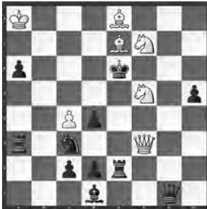
Aufgabe 7, Runde 3 Walter Jacobs British Chess Federation 1953, 2. Preis