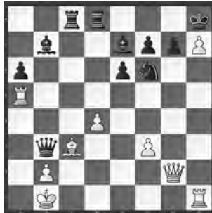
Ekström – N.N. Schweden, 1929.