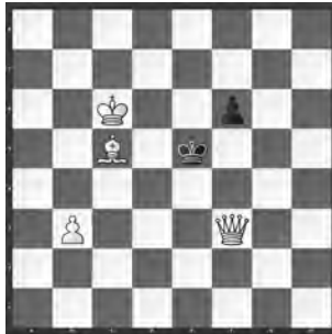
14995 Eligiusz Zimmer Piotrkow Tryb (PL)

14988 E. Zimmer. 1. ♖e6! ♖xh7 2. ♖f7 ♖h8 3. f4 ♖h7 4. f5 gxf5 5. ♖g7 f4 6. g6 (4. ... ♖h8 5. ♖g7+ ♖h7 6. fxg6). «Lebt davon, eine Miniatur zu sein; das wäre mir sonst zu dürftig, da es viel zu einfach lösbar ist und es nicht einmal ein Festina Lente gibt (wenn 3. f3 die richtige Fortsetzung gewesen wäre, anstatt 3. f4)» (RO). – «Hier fehlt mir die s Gegenwehr oder eine Überraschung!» (PN).