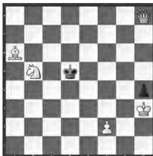
14999 Petrašin Petrašinović Belgrad (SRB)