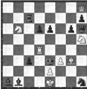
Aufgabe 2, Runde 1 Herbert Ahues und Albert Volkmann Arbejder Skak 1955, 1. Preis

8) I) 1. ♚c5 ♚xa3 2. ♞d4 ♞xa6 3. ♚d5 ♚d6 – II) 1. ♚d5 ♚f4 2. ♞c8 ♚d2 3. ♞c5 ♚d6 – III) 1. ♚e4 ♞f5 2. ♚d3 ♚xa7+ 3. ♚e4 ♚d6. Alle 3 weissen Figuren setzen auf d6 matt.