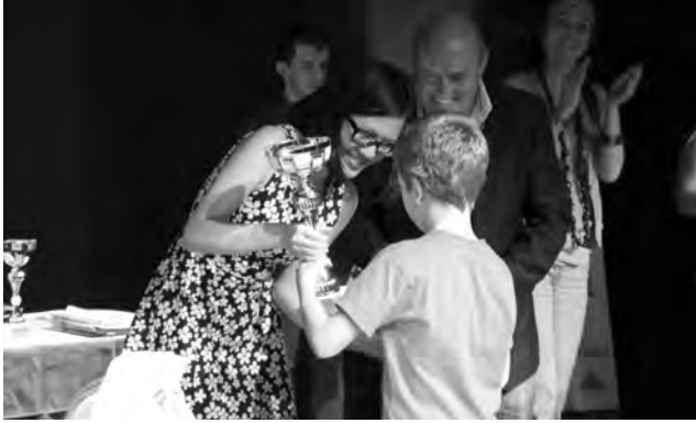
Corsican Circuit: la championne du monde Hou Yifan remet un trophée à un enfant sous les yeux de l'organisateur Léo Battesti.

championne du monde Hou Yifan qui étrennait une première participation. A noter qu'il était très intéressant de voir le joueur indien dans une ambiance aussi détendue, à seulement deux semaines de son match contre Magnus Carlsen!