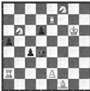
14997 Petrašin Petrašinović Belgrad (SRB)