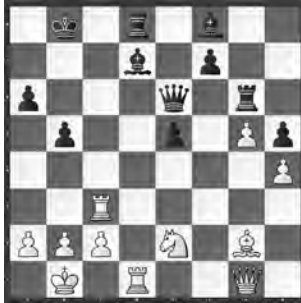
Fier – Nuri Zürich 2013, Meister

Wie nutzte Weiss die gelockerte schwarze Königsstellung aus?