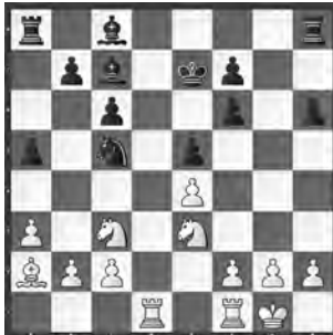
Popov – Pikula Zürich 2013, Meister

Welche Zaubereien fand Weiss in dieser scheinbar ruhigen Position?