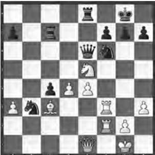
Zude – Arnelind Zürich 2013, Meister

Wie wandelte Weiss seinen Stellungsvorteil in etwas Zählbares um?