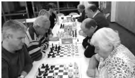
Beim Schachseminar in deutschen Rotenburg kam auch das Spielen nicht zu kurz.