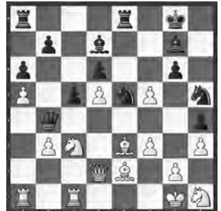
Abächerli – Goldie Zürich 2013, Allgemein

Welche Zaubereien fand Weiss in dieser scheinbar ruhigen Position?