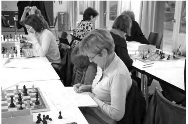
Der Schachklub Phönix in Zürich hat wiederholt Schachkurse und Turniere für Frauen angeboten und zählt heute mehr weibliche als männliche Mitglieder.

scheint mir auch, die Mitglieder mit einer kleinen Aufgabe zu betrauen und so den Zusammenhalt im Verein zu fördern. Natürlich sollte man ein Neumitglied nicht gleich am zweiten Abend für einen Posten im Vorstand anfragen und so abschrecken, aber kleine Aufgaben fördern meiner Ansicht nach die Integration in den Verein. Ebenso wichtig für