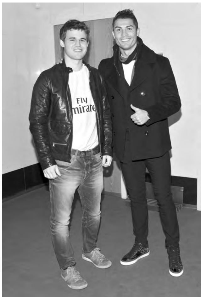
Le champion du monde Magnus Carlsen avec Ronaldo du Real Madrid.