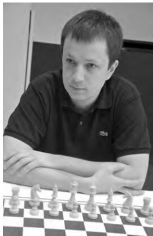
Beendete seinen ersten Auftritt in der Schweiz siegreich: Der polnische Grossmeister Radoslaw Wojtaszek.

19. ... bxa6 20. ♜xa6 ♟d7. Schwarz muss sich passiv verteidigen und wird in der Folge nicht einmal geringste Aktivität vortäuschen können. 20. ... ♜b8 21. b4! ♟e7 (21. ... ♜xb4 22. ♟xd5 ♜xb2 23. ♟b4, und Weiss steht klar besser) 22. ♜xa7 ♜g8 23. ♟a4, und die schwarze Stellung ist äusserst gefährdet. 21. b4 ♜b8 22. b5! Die Schliessung der b-Linie ist wichtiger als der b-Bauer selbst! 22. ... cxb5 23. ♟h5.