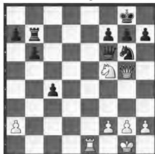
Aljechin – Frieman New York (Blindpartie), 1924

Welche Kombination fand der «blin- de» Aljechin mit Weiss?