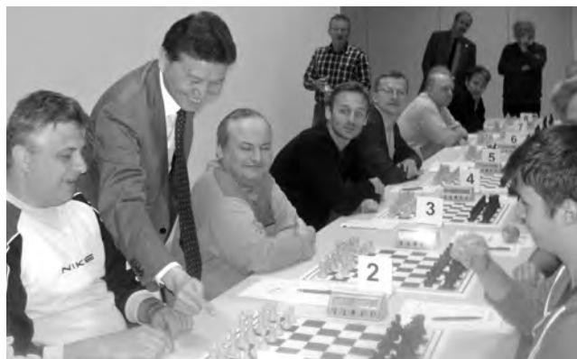
Prominenter Gast: FIDE-Präsident Kirsan Ilyumshinov führte in der 8. Runde in der Partie zwischen IM Gyula Izsak (links) und Luca Kessler am ersten Brett den ersten Zug aus.

1. e4 c5 2. ♗f3 ♗f6 3. e5 ♗d5 4. ♗c3 ♗xc3 5. dxc3 ♗c6 6. ♙f4 e6 7. ♙d3 h6 8. h4 b6 9. ♖e2 ♙b7 10. 0-0-0 ♖c7 11. ♗d2 d5 12. exd6 ♙xd6 13. ♙xd6 ♖xd6 14. ♖g4 0-0 15. f4 ♖c7 16.