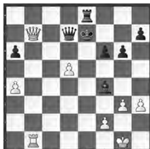
Capablanca – Subarew Moskau, 1925

Figur im Minus, dafür Königsatta- cke! Weiss am Zug.