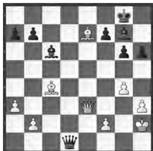
Zukertort – Steinitz St. Louis, 1886

Offene Königsstellung bei Weiss. Greifen Sie mit Schwarz an!