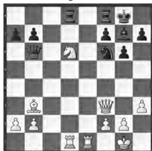
Kortschnoi – Gheorghiu Leningrad, 1968

Wie nutzte Weiss seine aktivere Stellung zu einer Kombination?