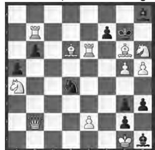
S # 2