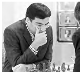
Verpasste in der sechsten Partie eine grosse Chance, um 3½:2½ in Führung zu gehen: Viswanathan Anand.

15. ... ♖b7 16. ♖d3 c5 17. ♖g3 ♖ag8. 17. ... ♖hg8? scheitert an 18. ♖d3 nebst ♖h7.