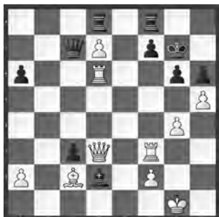
Kortschnoi – Polugajewski Tiflis, 1956

Wie verschaffte sich Weiss Zugang zum schwarzen König?