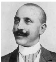
Henri Rinck (Foto: Wikipedia).

der zurück auf das Ursprungsfeld getrieben.