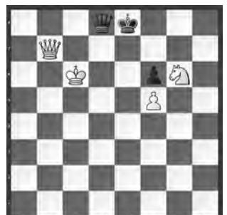
15006 Baldur Kozdon Flensburg (D)