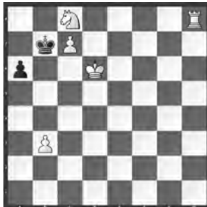
15003 Eligiusz Zimmer Piotrkow Tryb (PL)