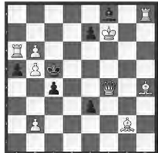
15004 Petrašin. Petrašinović Belgrad (SRB)