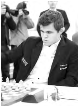
Verteidigte seinen WM-Titel souverän: Magnus Carlsen.

1. e4 e5 2. ♘f3 ♘c6 3. ♖b5 ♘f6. 4. d3. Magnus Carlsen wählte erst zu einem späteren Zeitpunkt im Wettkampf die Hauptvariante 4. 0-0. 4. ... ♖c5 5. 0-0 d6 6. ♗e1 0-0 7. ♖xc6 bxc6 8. h3 ♗e8 9. ♘bd2 ♘d7?!. Natürlicher war