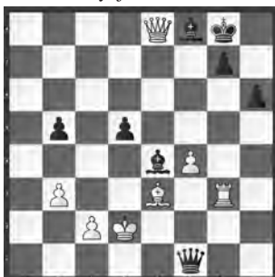
Kortschnoi – Portisch Reykjavik, 1987

Weiss machte kurzen Prozess. Wie ging das?