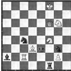
15001 Valerij Schanschin Tula (Rus)

14994 O. Mihalčo. 1. ♘e2! (2. ♙g3) e5 2. ♙xe5 ♙a3 3. ♗xg7! ♗f3 4. ♙d6! ♙e3 (4. ♙c7? ♗d3 5. ♘g3 ♙e3) 5. ♘g3! ♙e5! (5. ... ♗f3? 6. ♙e4) 6. ♙xe5 ♙e3 7. ♙e4 ♘xg4 8. ♙f6+ ♘h5 (8. ... ♘xf6 9. ♘xf6 10. ♗g4) 9. ♙g5! (10. ♘g3) ♘~ 10. ♘f6. «Ein begeisterndes Duell mit schwierig zu findenden stillen Zügen für das Schlussbouquet» (RO). – «Sehr schöner streng logischer Mehrzüger mit etlichen w Opfern!» (JB).