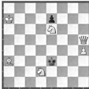
15177 Petrašin Petrašinović Belgrad (SRB)