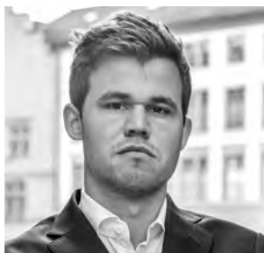
Seit 2013 Weltmeister: Magnus Carlsen.

ma. Magnus Carlsen bleibt im Schach das Mass aller Dinge und verteidigte in London zum dritten Mal seinen Weltmeisterschaft-Titel, den er seit 2013 innehat. Zwei Tage vor seinem 28. Geburtstag schlug der Norweger seinen zwei Jahre jüngeren amerikanischen Herausforderer Fabiano Caruana mit 3:0 in den (einseitigen) Kurzpartien.