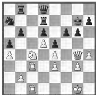
Svane – Zude Meisterturnier

Wie beendet Weiss die Partie in wenigen Zügen?