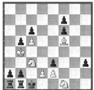
15180 Oto Mihalčo Košice (SVK)