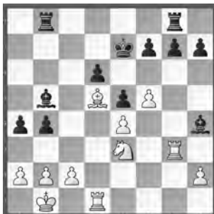
Löffler – Narayanan Meisterturnier

Wie beendet Weiss die Partie in wenigen Zügen?