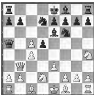
Svane – Simon Meisterturnier

Mit welchem Kraftzug kann Weiss gewinnen?