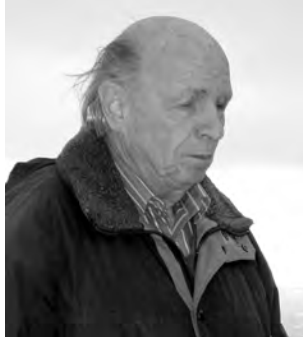
Heinz Gfeller war ein unermüdlicher Werber fürs Kunstschach

5) 1. dxc3/dxe3/d3? b3/♙f1/a5! – 1. d4! (Zzw.) b3 2. ♙f1+ exf1 3. ♖xc3 1. ... ♙f1 2. ♖xe2+! ♜xe2 3. ♖xe3 1. ... a5 2. ♞c1 ~ 3. ♞d3. Albino in Verführungen und Lösung.