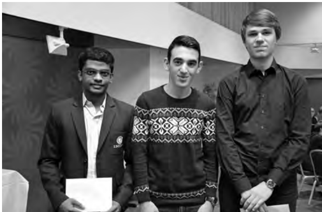
Das Siegertrio des Meisterturniers (von links): GM Sunilduth Narayanan (3.), GM Haik Martirosjan (1.), GM Rasmus Svane (2.).

1. d4 ♖f6 2. c4 e6 3. ♗c3 ♗b4 4. e3 b6 5. ♗d2 Ein seltener Zug. Häufiger werden 5. ♗ge2 und 5. ♗d3 gespielt.