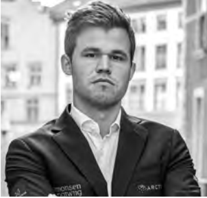
Magnus Carlsen, champion du monde depuis 2013.

Le champion du monde Magnus Carlsen a conservé son titre, dans un match plus «plat» que les précédents. Le norvégien a manqué la plus grosse occasion dès le premier jour, puis Fabiano Caruana aurait pu l'emporter lors de la 6 ème partie. Au final, douze nulles, et le champion de monde l'a emporté aux départages avec facilité, catapultant l'américain par 3 à 0. Voici un résumé du match.