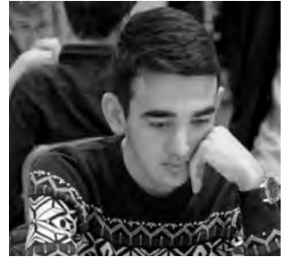
Entschied die Partie in der Zeitnot: GM Haik Martirosjan.

27. exf4 ♖xf4 28. ♜e1 ♖c7 29. ♖a4 ♖cf7 30. ♜g2 ♖e4 31. ♖c8+ ♜h7 32. ♖a8. Das ist riskant, aber objektiv noch in Ordnung. Die Dame verliert