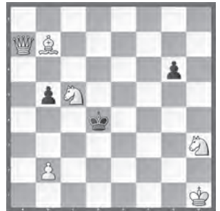
15316 Petrašin Petrašinović Belgrad (Srb)