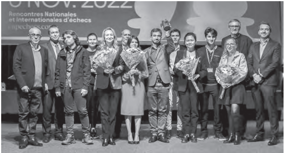
Les joueurs du Trophée Capéchech et une partie de l'équipe d'organisation.