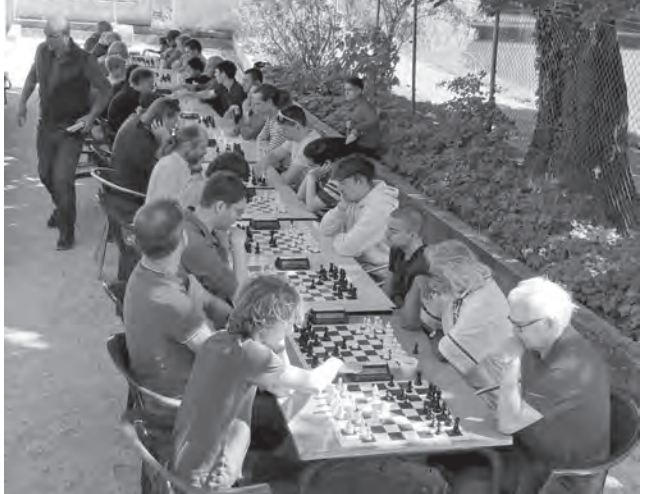
Open-air-Events machen den SKB sichtbar.