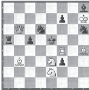
15313 Herbert Ahues Publikation post mortem

15305 R. Krättschmer. Satz: 1. ... ♚xe2+ 2. ♚xe2 1. ♚d1?? ♚xe2 matt! - 1. ♚g5! (2. ♚e5+ ♚d4 3. c3, e3, ♚e3) hxg5 2. ♚d1! (3. ♚d4) ♚xe2+ 3. ♚xg5 ♚xd1 (3. ... ♚xg2 4. ♚d4+ ♚f3 5. ♚f4) 4. ♚c3+ ♚e3 5. ♚c4. Berlinthema mit attraktivem Mattbild (Autor). - «W steckt beide ♚ für die Lösung »ins Geschäft!« (JB).