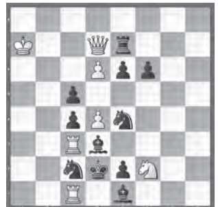
6 Ricardo de Mattos Vieira Die Schwalbe 2003