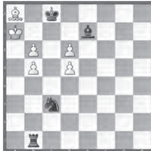
3 David Gurgenzidze Die Schwalbe 1999 2 Ehrende Erwähnung