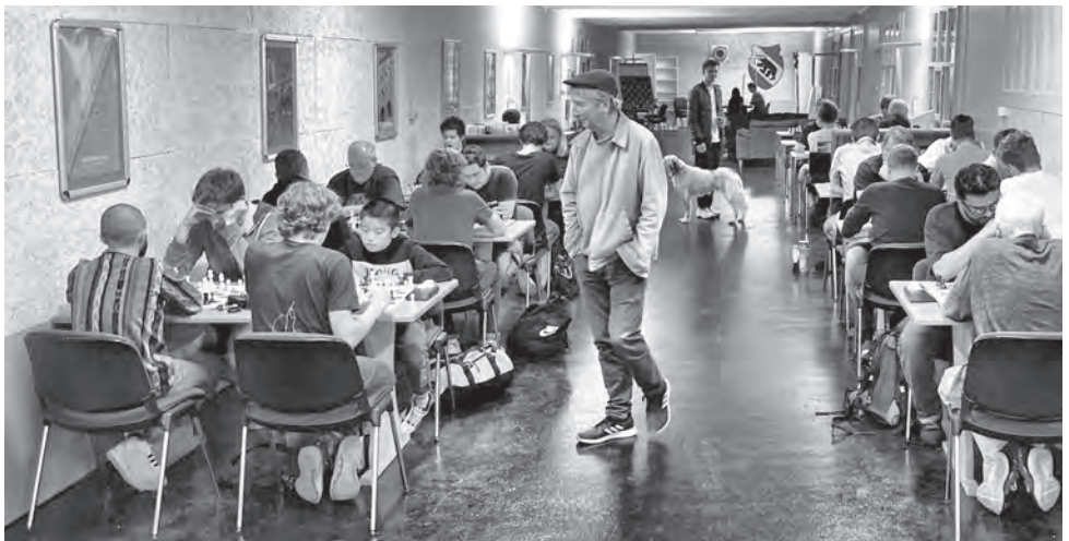
Das neue Spiellokal ist ein wesentlicher Erfolgsfaktor für den SK Bern.