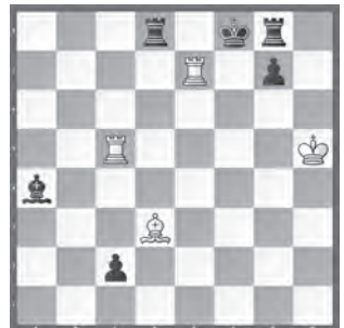
Weiss zieht und hält remis

2.–4. Ehrende Erwähnung, Belyakin-100 Gedenkturmier 2021