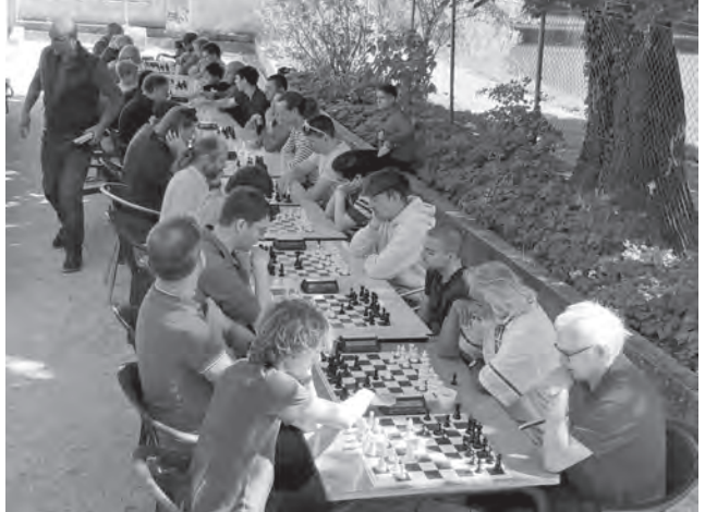
Les événements en plein air ont rendu le CE de Berne visible durant le confinement.