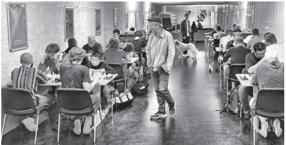
Le nouveau local est un facteur du succès actuel du club de Berne.