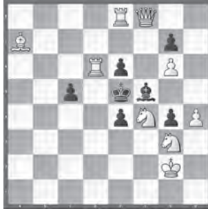
1 Ismo Tompuri Suomen Shakki 2005, 4. Preis

6) a) 1. ♖xd4 dxe7 2. ♖c2 ♖1xc2 – b) 1. ♖xd6 dxc5 2. ♖e4 ♖xe4. Die ♖♗ machen für den ♖ Platz.