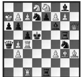
Swaminatha Subrahmanyam The Problemist 1929 2. Preis

1. c8d! (2. Sc7) Tee5/Tge5/Le5/S7e5/S4e5/e5 2. Td1/Dd2/D(h)e6/D(c)e6/Le6/fxg8D(L); 1. ... Dc6 2. Dxc6. Ganze 27 Steine machen den Wahnsinn möglich!