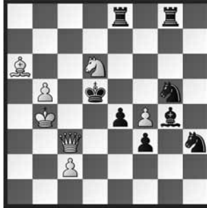
1 Walter Grimshaw Illustrated London News 1850