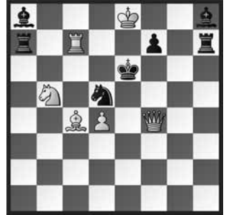
2 Lew Loschinskij Tidkrift vd KNSB 1930 2. ehrende Erwähnung