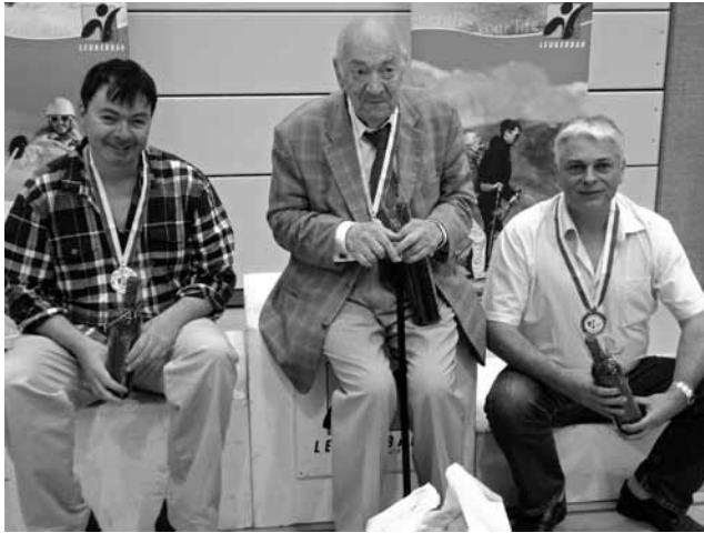
Das Siegertrio der Schweizer Meisterschaft (von links): GM Joe Gallagher (2.), GM Viktor Kortschnoi (1.), IM Beat Züger (3.).