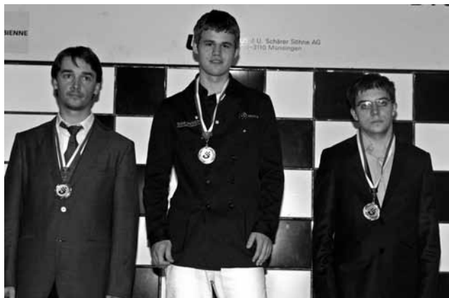
Das Siegertrio im ACCENTUS-Grossmeisterturnier (von links): GM Alexander Morosewitsch (2.), GM Magnus Carlsen (1.), GM Maxime Vachier-Lagrave (3.).

Es ist schwierig, sich vorzustellen, was die Organisatoren des Bieler Festivals für die 2011er-