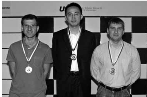
Das Siegertrio im Meisterturnier (von links): GM Tigran Gharamian (2.), GM Ni Hua (1.), GM Alexander Kowtschan (3.).

1. ♖f3 d5 2. d4 ♖f6 3. c4 c6 4. ♗c3 e6 5. e3 ♗bd7 6. ♔d3 dxc4 7. ♙xc4 b5 8. ♔d3 ♙b7 9. 0-0 a6 10. e4 c5 11. d5 c4 12.