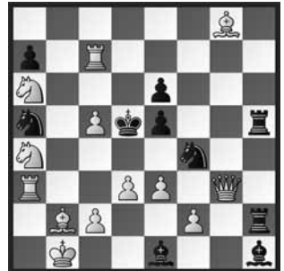
4 Sergej Pugatschew 10. Allrussische Meisterschaft 1979, 2. Preis