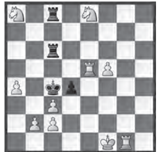
4 Milan Vukcevic Trivanović-Memorial 1981/82 1. Preis (V.)