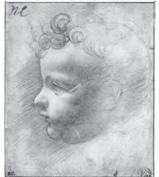
Voici une Etude pour l'Enfant Jésus conservée au Louvre...

rochers et les amateurs ont pu se rendre compte à quel point la beauté ne doit rien au hasard. Au milieu de dizaines d'esquisses ou d'«études», comme disent les historiens de l'art, prêtées par sa Majesté la Reine, trônaient ainsi, l'un en face de l'autre, deux des plus grands chefs-d'œuvre de l'humanité.