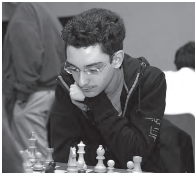
Fabiano Caruana ha vinto brillantemente il torneo rapid di Pfäffikon/SZ.