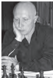
Gab wieder mal ein Gastspiel in der Schweiz: GM Vladimir Tukmakow, der in Pfäffikon/SZ Zweiter wurde.

Wenn man Olympiasieger Wladimir Tukmakow, Seniorenweltmeister Miso Cebalo und jüngere Grossmeister mit einer ELO-Zahl jenseits der 2600er-Marke wie Tornike Sanikidze oder Viorel Iordachescu in einem Turnier begrüssen darf, dann vermengt sich ein Hauch von Geschichte mit Ehrfurcht, Stolz und Freude. Welch eine würdige Grundlage für ein 75-Jahr-Vereinsjubiläum!