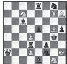
Jurij M. Gordian Bulletin Problémistic 1976 1. Preis

mh. Virtuose Plachutta-Darstellungen sind nicht so rar wie man denken könnte. Hier gelingt dem bekannten russischen Komponisten Gordian ein gordischer Knoten, der nicht leicht zu lösen ist. Er kombiniert die Idee mit Vektor-Unterbrechungen (Vektor = Wirkungslinie) durch präzises Batteriespiel: 1. d5! (2. Le7+/Le3+) Dxd5 2. Le3+ Kh4 3. Sxf3+ Dxf3 4. Lg5+ Kg4 5. Le7+ Kf4 6. Se6 1. ... Lxd5 2. Le7+ Kf4 3. Se6+ Lxe6 4. Lg5+ Kg4 5. Le3+ Kh4 6. Sxf3. Durch die T/L-Batterie können mittels reziproker 2. und 5. Züge des weissen Läufers weitere Verteidiger ausgeschaltet werden.