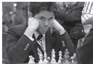
Pour Hikaru Nakamura, triple champion des Etats-Unis, s'agira-t-il d'un retour au Palais des Congrès de Bienne après une longue absence.