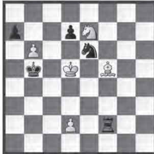
Alexey Troitsky, Deutsche Schachzeitung , 1909

1. b7 ♖c7+. 1. ... ♖xd2+ 2. ♔e5. 2. ♔d6! ♖a6 3. ♕d3+! ♔b6. 3. ... ♔a5 4. ♕xa6 ♖xd2+ 5. ♔c7 ♖b2 6. ♕c4. 4. ♕xa6 ♖xd2+ 5. ♖d5+ ♖xd5+ 6. ♔xd5 ♔c7 7. b8 ♖+ ♔xb8 8. ♔d6 ♔a8 9. ♔c7 d5 10. ♕b7#.