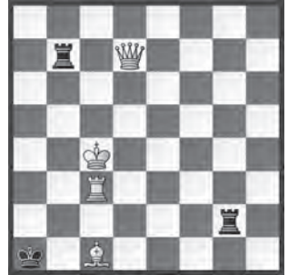
2 Jacques Rotenberg Die Schwalbe 1980