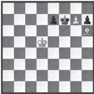
Alexey Troitsky, Novoye Vremja , 1895

1. g8 ♖+ ♔xg8 2. ♔e6 ♔h8 3. ♔f7 e5 4. ♕g7#.