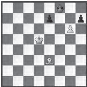
Alexey Troitsky, Novoye Vremja , 1895

1. ♕h6+ ♔g8 2. g7 ♔f7. 2. ... e6+ 3. ♔d6! ♔f7 4. ♔e5 ♔g8 5. ♔f6; 2. ... e5 3. ♔e6 e4 4. ♔f6. 3. g8 ♖+! ♔xg8 4. ♔e6 ♔h8 5. ♔f7 e5 6. ♕g7#.