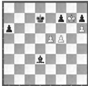
Weiss zieht und gewinnt

«Schweizerische Arbeiter-Schachzeitung», 1947