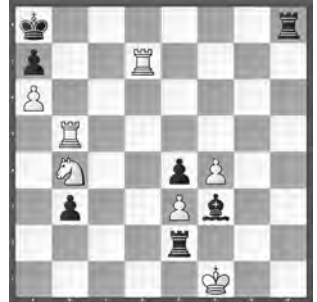
3 Philipp Stamma 1792