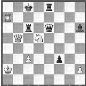
1 Philipp Stamma 1792

Der Syrer Philipp Stamma schuf im 18. Jahrhundert eine Reihe von faszinierenden Schachaufgaben. Meist droht der Gegner mit undeckbarem Matt. Deshalb ist bei der Lösung höchste Präzision gefragt, was die exakte Variantenberechnung trainiert!