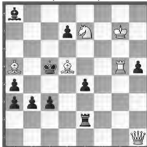
3 Miroslav Havel Stratford Express 1949 (2. Runde)