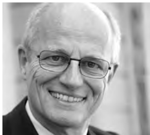
SSB-Zentralpräsident Peter A. Wyss: «Wir wollen Spieler(innen), welche die Schweiz auch international vertreten, bewusst fördern.»

An den kommenden Schweizer Einzelmeisterschaften in Grächen (siehe Ausschreibung und Rahmenprogramm auf den Seiten 18 bis 26) kommen nur noch Spieler(innen) in den Genuss von Spezialkonditionen (Startgeld/Hotel) und Spezialpreisen für die besten Schweizer(innen), die beim Weltschachbund FIDE unter SUI gemeldet sind. Spieler(innen), die über den Schweizer Pass verfügen, hingegen unter einer anderen Föderation bei der FIDE firmieren, können – entgegen einer ursprünglich restriktiver ins Auge gefassten Regelung – zwar weiterhin Schweizer Meister(in) werden.