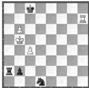
Weiss zieht und gewinnt

«Deutsches Wochenschach», 1900 (Korrektur von Mario García, 2008)