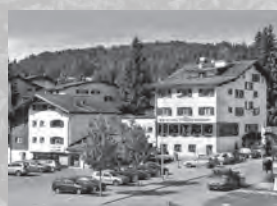
Hotel Collina*** Voa Sporz 9 7078 Lenzerheide

Gemütliches und sportliches Ferienhotel an sehr sonniger Lage. Das Hotel steht abseits vom Durchgangsverkehr, aber dennoch zentral mitten in Lenzerheide.