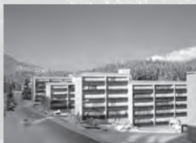
Ferienwohnungen Seestrasse*** Voa davos Lai 8 Haus Sursilvana 7078 Lenzerheide

Nachfolgend finden Sie die teilnehmenden SEM-Partnerbetriebe.