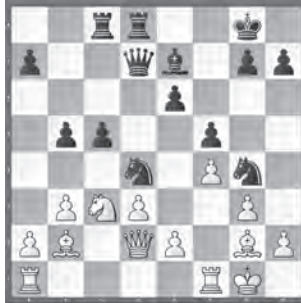
Yankelevich – Moroni Accentus Young Masters 2018

Wie verstärkte Schwarz seine Initiative?