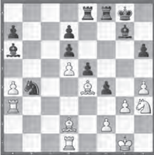
Studer – Yankelevich Accentus Young Masters 2018

Der schwarze Springer hat keine Felder. Wie kann Schwarz dennoch Materialverlust abwenden?