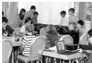
Das Jugendschachlager findet im Casa Fadail statt, das nur Minuten vom Turnierlokal entfernt ist.

Anmeldungen werden jeweils bis 9.15 Uhr direkt vor Ort oder vorher über die E-Mail-Adresse schachtraining.sem@gmail.com entgegengenommen.