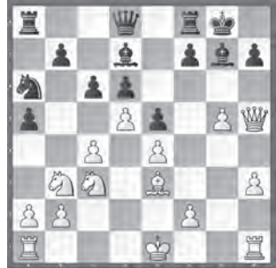
Yankelevich – Bänziger Accentus Young Masters 2018

Wie kann Schwarz Kompensation für den geopfertem Bauern entwickeln?