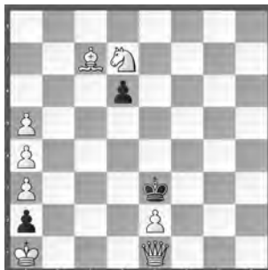
15149 Petrašin Petrašinović Belgrad (SB)