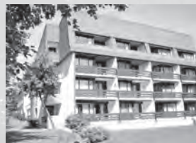
Ferienwohnung Clois/Mohn**** Voa Sporz 5 B 7078 Lenzerheide

In der Region Lenzerheide gelegen und mit direktem Zugang zu den Skipisten und Bikewegen begrüsst Sie dieses ***Superior Designhotel.