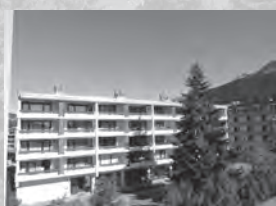
Ferienwohnung Astoria/Siebourg*** Voa Sporz 10 7078 Lenzerheide

Sehr schöne, neu möblierte 3½-Zimmer-Wohnung mit Balkon in ruhiger und zentraler Lage.