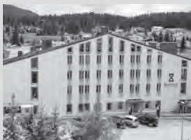
Bestzeit Lifestyle & Sport Hotel*** Oberbergstrasse 20 7076 Parpan

Willkommen im Hotel Schweizerhof. Luxus, Design, Natur. Geschichte, Tradition und Moderne. «Alpenchic» der neuen Art. Sich wohlfühlen wie daheim!