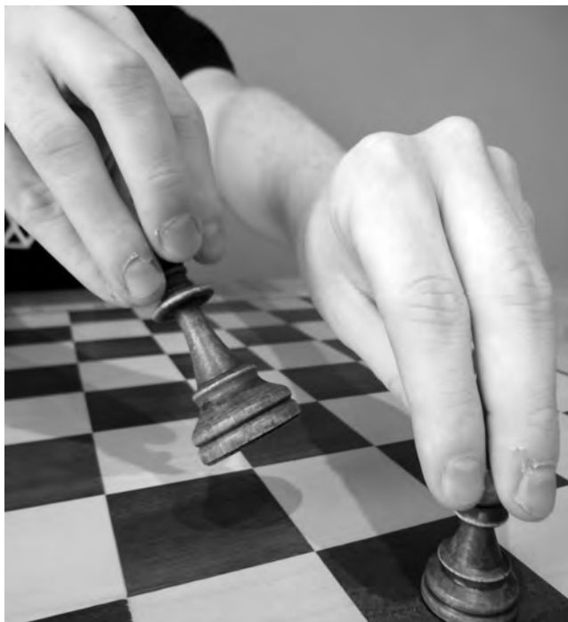
On ne doit pas utiliser les deux mains pour promouvoir un pion en dame. Mais selon le dernier jugement du Tribunal arbitral de la FSE, il est permis de passer la dame d'une main vers la main qui a joué le pion et qui va terminer le coup.

La façon dont X.Y. a exécuté pour la deuxième fois le coup de promotion – ce qui en réalité