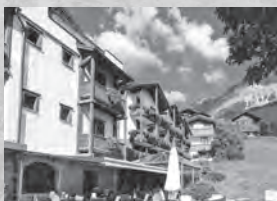
Hotel Spescha*** Voa Principala 60 7078 Lenzerheide

Das Hotel Dieschen verspricht einzigartige Bergerferien in unmittelbarer Nähe der Rothorn Talstation.