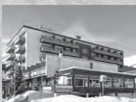
Sunstar Alpine Hotel**** Voa Sporz 8 7078 Lenzerheide

Die RESIDENZ ASTORIA befindet sich mitten im Ortszentrum an ruhiger und zentraler Lage, in Seenähe.