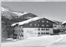
Hotel Dieschen*** Voa Plam Nesa 2 7078 Lenzerheide

Der Bergsommer lädt ein zum Wandern, Laufen, Joggen und Biken. In Parpan sind Sie schon auf halber Höhe! Die Berge rufen – vorbei an Maiensässen, Alpen hinauf zu den Gipfeln.