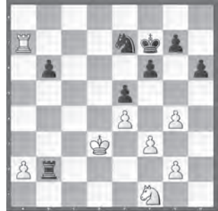
Bänziger – Studer Accentus Young Masters 2018

Wie kann Weiss überraschend Vorteil eringen?