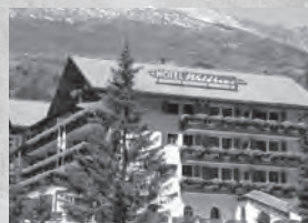
Hotel Waldhaus am See*** Hauptstrasse 7077 Valbella

Familiär geführtes Drei-Sterne-Hotel im Zentrum von Lenzerheide, direkt an der Promenade.