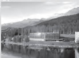
Revier Mountain Lodge Voa Principala 84 7078 Lenzerheide

Familie Ulber vermietet gemütlich ausgestattete 2½- und 3½-Zimmer-Wohnungen.