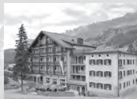
Hotel Alpina*** Hauptstrasse 33 7076 Parpan

Mit der Revier Mountain Lodge Lenzerheide ist das erste New-Generation-Hotel im Alpenraum entstanden.