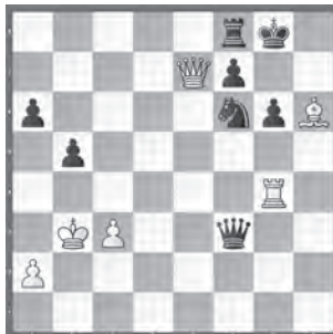
Studer – Fröwis (Fortsetzung) Accentus Young Masters 2018

Mit welchem taktischen Schlag fiel Schwarz über den weissen König her?