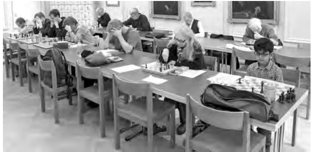
Die Schweizer Austragung des International Solving Contest 2018 wurde im Lokal des Schachklubs Bern durchgeführt.

4) Satz: 1. ... d5 a/♜b5 b/♜d5 2. ♠d7 A/♖a4 B/♠f3 1. ♠b3? d5 2. ♠d4; 1. ... h3!; 1. ♠h3? ♜d5 2. ♠g2; 1. ... d6! – 1. ♠b7! (2. ♖c4) d5 a/♜b5 b/♜d5 2. ♖a4 B/♠d7 A/♠b4 (Zagorjuk).