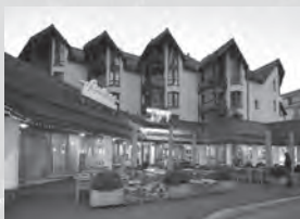
Hotel Schweizerhof**** Voa Principala 39 7078 Lenzerheide

Ferienregion Lenzerheide Voa Principala 80 7078 Lenzerheide Tel. 081 385 57 00 E-Mail: info@lenzerheide.com