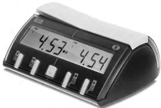
Turnierleiter und Schiedsrichter müssen inskünftig in der Lage sein, die Zeitgutschrift von einer oder zwei Minuten auf den elektronischen Uhren schnell einzustellen.