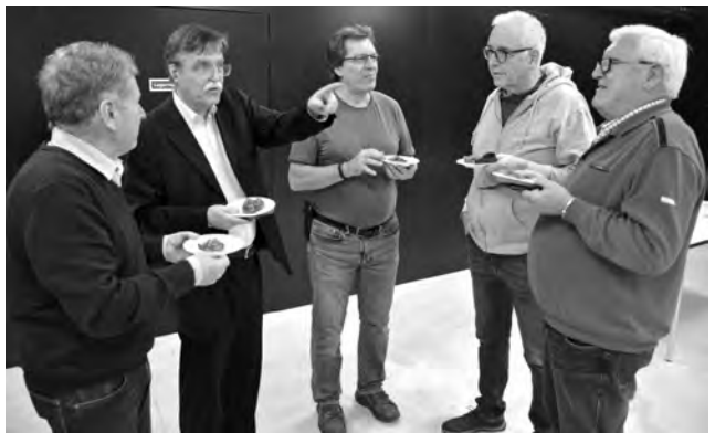
Soziale Kontakte sind im SC Seebach genauso wichtig wie das Schachspielen.

Mit regelmässigen Aktionen – «Schachmeile» (ein Outdoor-Event), Teilnahme an öffentlichen Events wie die Neuzuzüger-Veranstaltung des Quartiervereins, Flyer-Verteilung bei Neuüberbauungen und in der Seebach-Badi – erhöht der Verein seine Sichtbarkeit. Dabei lieferte das Projekt Generation CHess des Schweizerischen Schachbun-