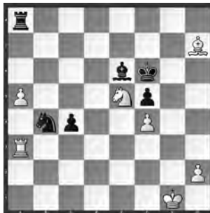
Gschnitzer – Laurent-Paoli

Vieles spricht hier für Schwarz. Nutzen Sie alle Ressourcen für Vorteil!