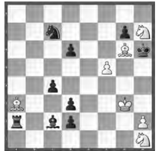
15330 Evgenij und Valerij Kirillov (RUS) und Igor Jarmonov (UKR)