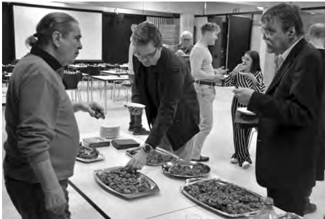
La cuisine dans le local de jeu est un facteur important pour le CE de Seebach.