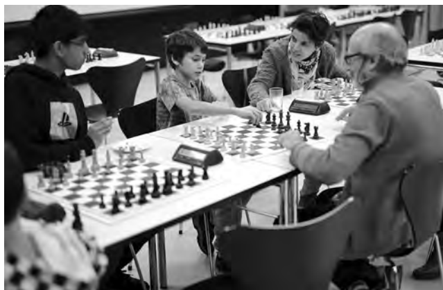
Parmi les éléments à succès du Club de Seebach figure le fait que de nombreux juniors de la relève sont intégrés à la vie du club.

Bien que plusieurs clubs et deux écoles d'échecs soient présents dans un rayon de 15