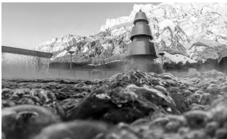
Vom 15. bis 23. Juli finden in Leukerbad die Schweizer Einzelmeisterschaften statt.

(die detaillierte Ausschreibung finden Sie in dieser Ausgabe)