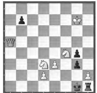
4 Schach-Echo 1963