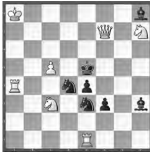
15325 Herbert Ahues Publikation post mortem

15318 O. Mihalčo. 1. ♖b6! (2. ♖d7) ♖c7 2. ♖f1 ♖c3 3. ♖g2 ♖d3 4. ♖b7 ♖d8 5. ♖a6! f1 ♖ 6. ♖xf1 ♖d4 7. ♖a6 (8. ♖c8 ♖d7 9. ♖xd7) ♖d7 8. ♖c4 (8. ♖c8? ♖xb6) ♖d5 9. ♖xd5. Duell s ♖/w ♖, Brennpunkt, Rundlauf und Switchback (Autor). – «Tolles Duell zwischen w ♖ und s ♖!» (JB).