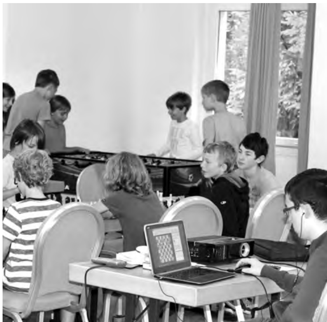
Das SEM-Jugendschachlager bietet ein abwechslungsreiches Programm.

► Kosten: Für Unterkunft, Verpflegung, Turniereinsatz und Schachtraining (Kinder und Ju-