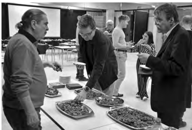
Die Küche ist für den SC Seebach ein wichtiger Faktor.

Stichwort externe Turniere: In der Schweizerischen Mannschaftsmeisterschaft 2022 spielte der SC Seebach mit zwei Teams