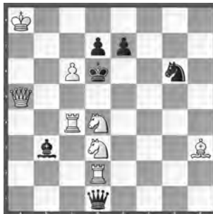
3 Die Schwalbe 1962 2. Preis