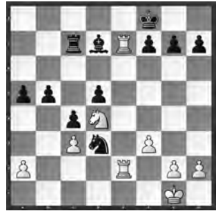
Asllani – Gschnitzer

Schwarz am Zug. Wie gewinnen Sie die Qualität mit Vorteil zurück?