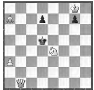
15328 Petrašin Petrašinović Belgrad (SRB)