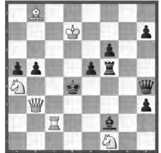
2 Die Schwalbe 1952 1. Preis (1952/II)