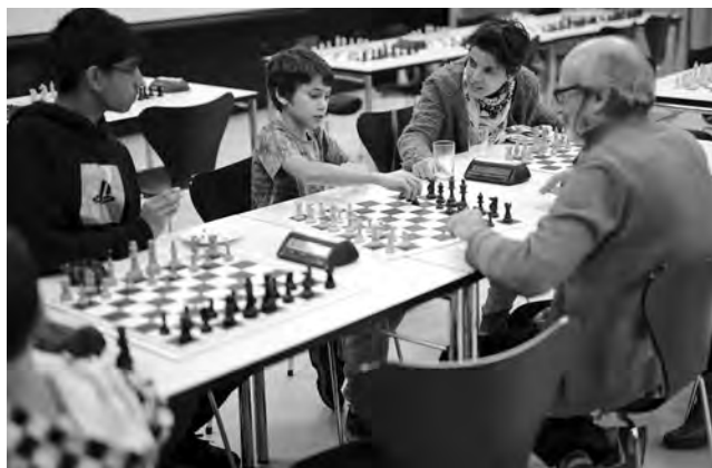
Zum Seebacher Erfolgskonzept gehört, dass Nachwuchsspieler(innen) nahtlos ins Klubleben integriert werden.