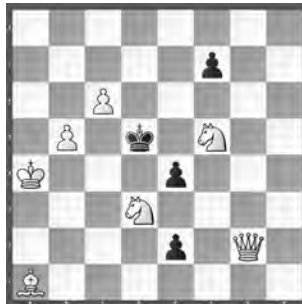
1 Schweizerische Schachzeitung 1951

Inh verband eine Freundschaft mit Herbert Ahues (1922–2015) und Josef Kupper (1932–2017, an dessen Buch «60 Jahre Freude am Kunstschach» (2006) er wesentlich beitrug. Er amtierte zudem von Mai 1962 bis April 1965 als «SSZ»-Redaktor und war später Mitglied des Vorstands der Schweizerischen Vereinigung der Kunstschachfreunde).